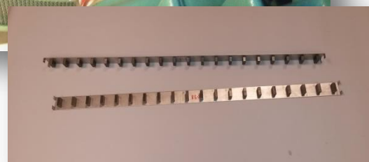
Knaggband med 20 knaggar till trafikverket